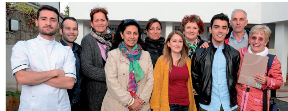
La nostra Delegazione in visita e quattro Infermieri italiani che operano nella Struttura irlandese