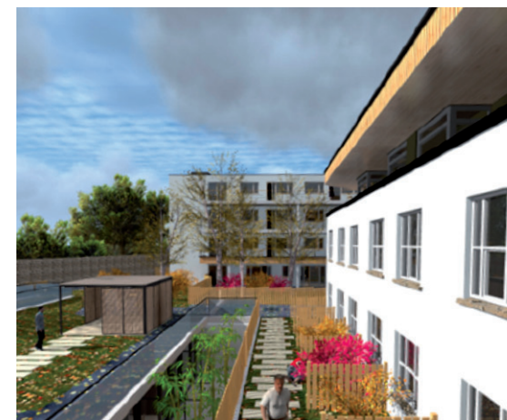
Vista esterna della Orwell Nursing Home in Dublino

I servizi offerti sono: residenza per Anziani, ricoveri di sollievo, assistenza ai Pazienti con Alzheimer, cure palliative e ricoveri per convalescenza.