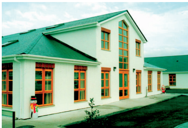
La struttura della Innis Ree Nursing Home

Innis Ree Nursing Home Lodge è situata in una zona tranquilla sul fiume Shannon, a sole 10 miglia dalla città della contea di Roscommon e Longford. È dotata di camere singole con bagno. Ogni camera dispone di un sistema di chiamata per l'Infermiere, telefono e tele-